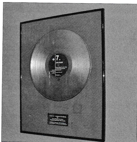
Ausgewählte Besonderheiten schmücken die Wände des Blasmusikarchivs: hier die Kopie der 7. Goldenen Schallplatte für Ernst Mosch und seine „Original Egerländer Musikanten“, im Original verliehen im September 1970 in Ulm/Donau.