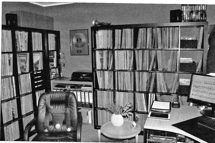
Ein Blick in die Archivräume: Hier lagern Tausende von Schallplatten, Musikkassetten und CDs mit Egerländer und böhmischer Blasmusik.

Und um es abschließend mal mit einigen böhmischen Musiktiteln auszudrücken: Egal, ob bei einem „Falkenauer Bummel“ (Polka, Ernst Mosch), bei einem Spaziergang „Im Kaiserwald“ (Walzer, Günther Fuhlisch), beim Lauschen der „Rauschenden Birken“ (Walzer, Vaclav Kaucky) in den endlosen Alleen des Egerlandes, beim Besuch des „Gossengrüner Zuckerbäckers“, beim „... Knödel kochen“ (Polka, Karel Vacek), beim Flirt mit der „Schönen Egerländerin“ (Walzer, Ernst Mosch) im „Mondschein an der Eger“ (Walzer, Ernst Mosch)