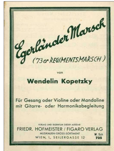
Titelblatt „Egerländer Marsch“ (Verlag Friedrich Hofmeister, Wien)