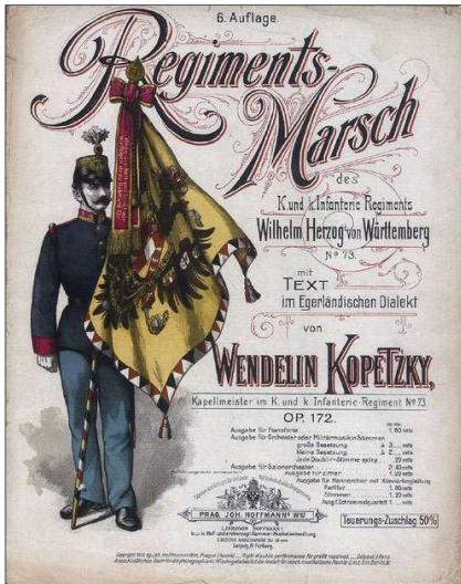
Titelblatt „Egerländer Marsch“ (Verlag Johann Hoffmann, Prag)